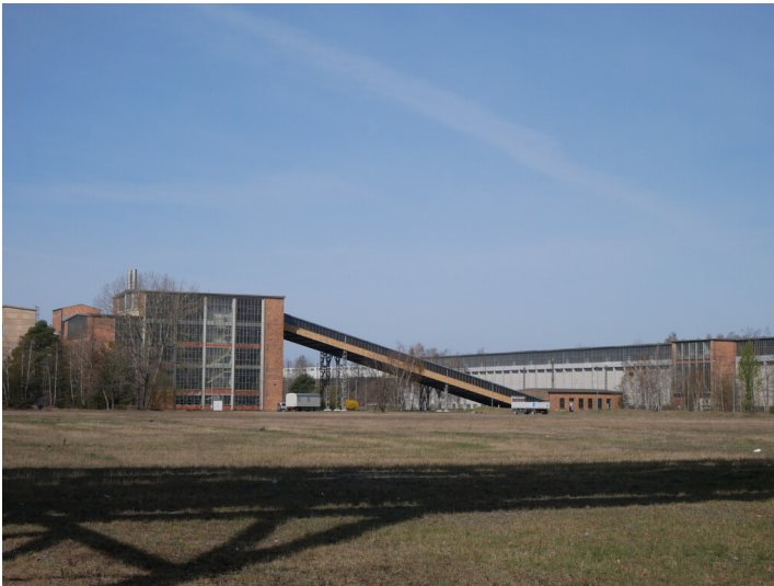
Bandanlage Brikettfabrik Mitte Schwarze Pumpe (2022)