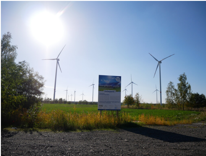
Solarpark Klettwitz Nord / Energiepark Lausitzer Solarpark I