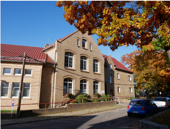
Heimatstube Kostebrau