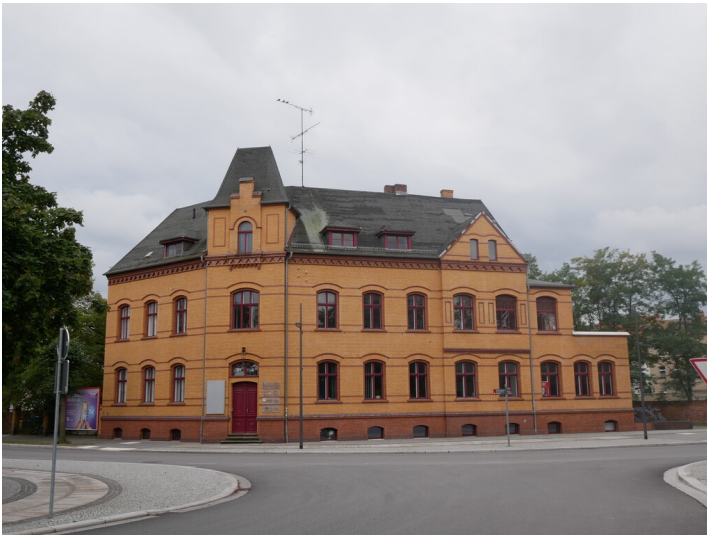
Verwaltungsgebäude Zschipkau-Finsterwalder Eisenbahn