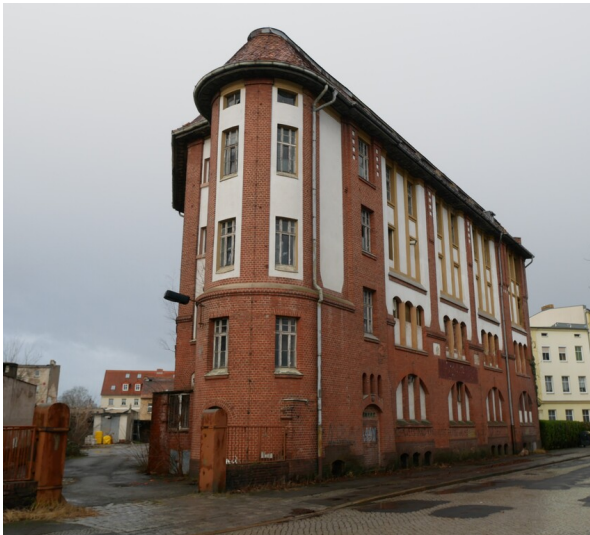
Zentrallager des Konsumvereins Forst

Schlagwörter: Lagergebäude Fachsicht(en): Denkmalpflege Gemeinde(n): Forst (Lausitz) Kreis(e): Spree-Neiße Bundesland: Brandenburg