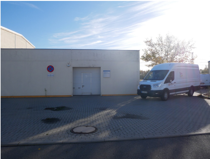
Lager der Feuerwehr