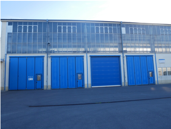
Halle 7, Gebäude 30