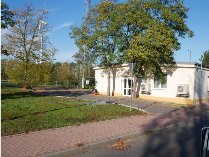
GWN Fotograf/Urheber: Franz Dietzmann