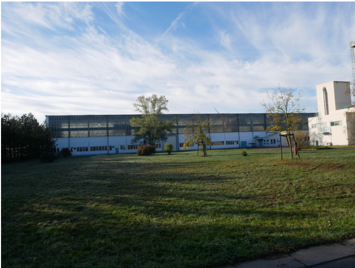
Halle 6, Gebäude 20