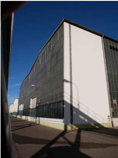
Halle 2 und 3