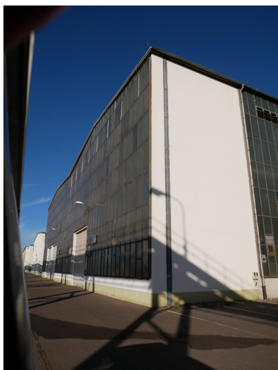
Halle 2 und 3