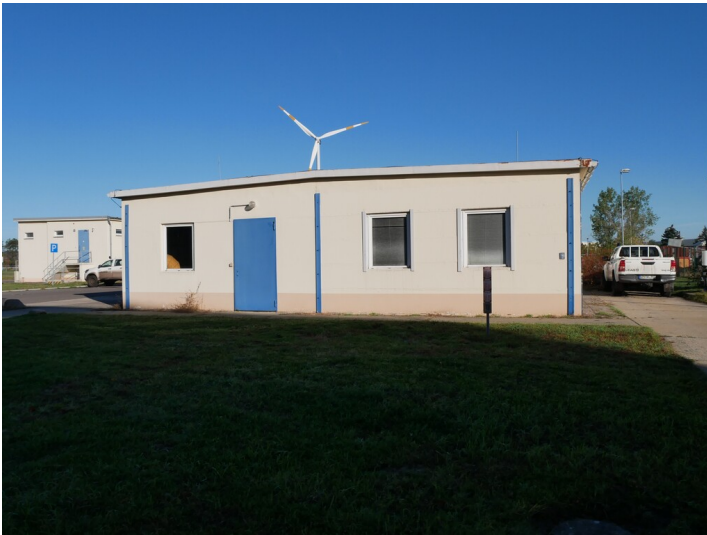
E-Werkstatt II

Schlagwörter: Tagesanlage Fachsicht(en): Denkmalpflege Gemeinde(n): Cottbus Kreis(e): Cottbus Bundesland: Brandenburg