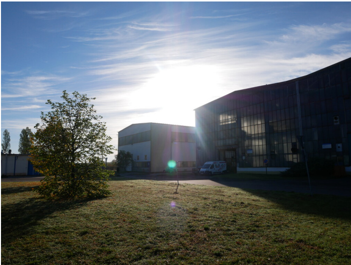
Halle I

Schlagwörter: Tagesanlage Fachsicht(en): Denkmalpflege Gemeinde(n): Cottbus Kreis(e): Cottbus Bundesland: Brandenburg