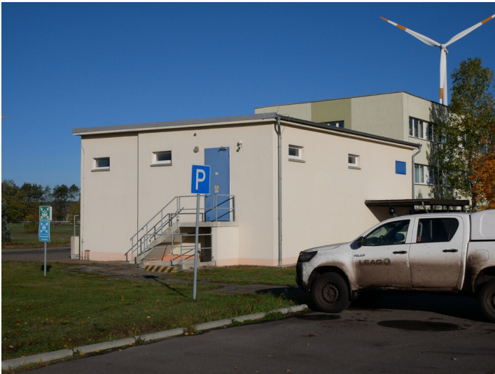
Zentrale Stromversorgung