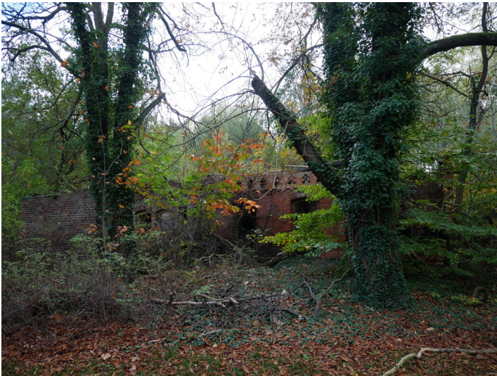
Bahnhof Sallgast