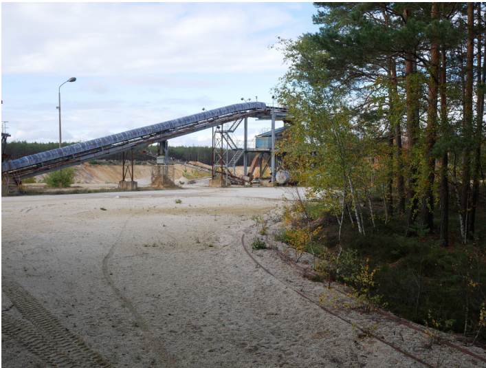
Tongrube Klinkerwerk Lichterfeld