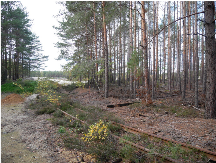
Schmalspurbahn Klinkerwerke Lichterfeld