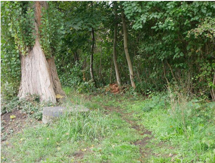
Abschnitt des ehemaligen Weges zur Brikettfabrik und zur zur Villa Delius