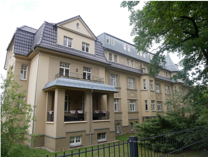
Ledigenwohnheim Lauchhammer AG