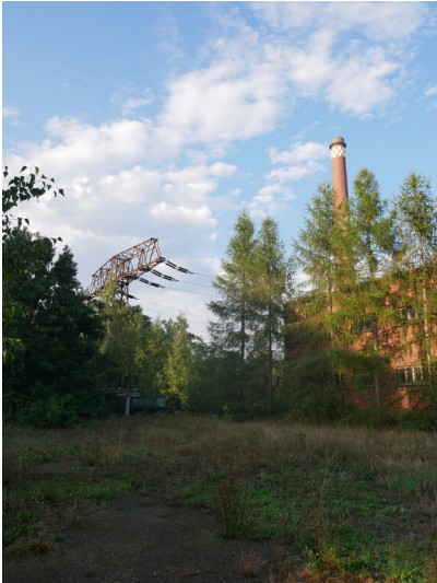
110 kV-Freileitungsmast