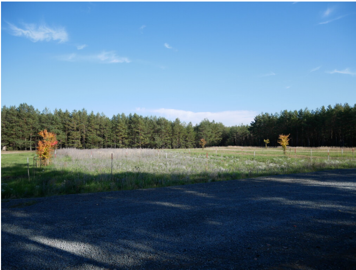
ehem. Zentrum Vogelberg