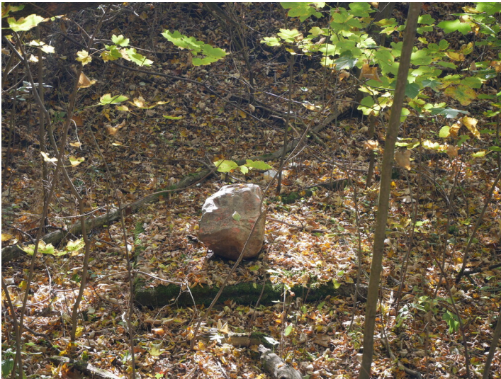
Schachtanlagen, verm. Braunkohlengrube Felix