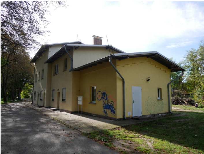
Bahnhof Klettwitz