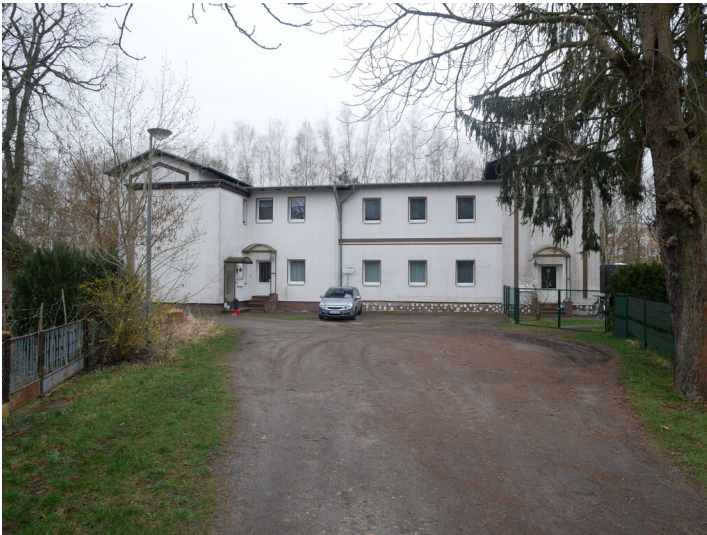
Bahnhof Schipkau