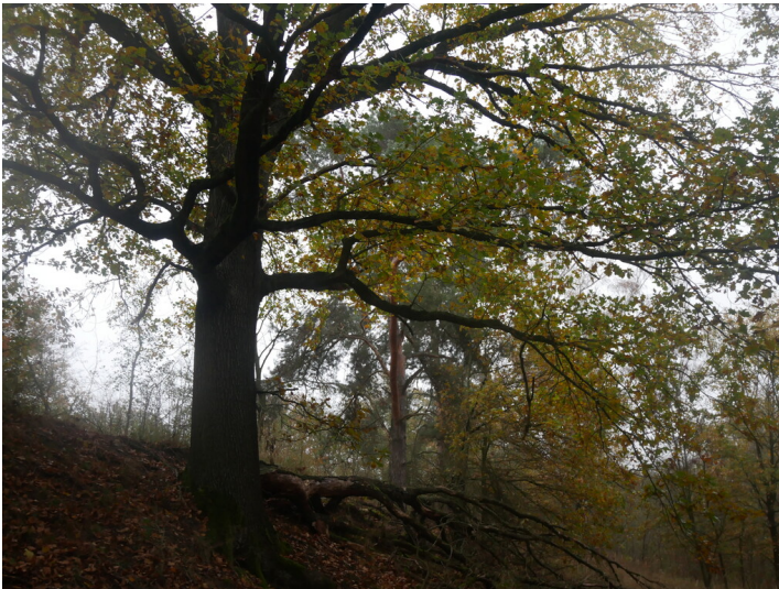
Aufforstung Hochkippe nördlich Annahütter See