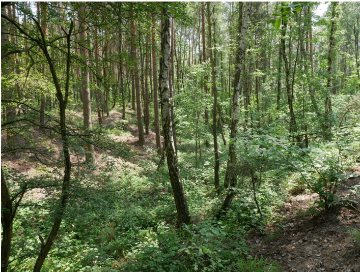
Tiefbaubruchfelder der Gruben Henriette, Bismarck II, Margaretha