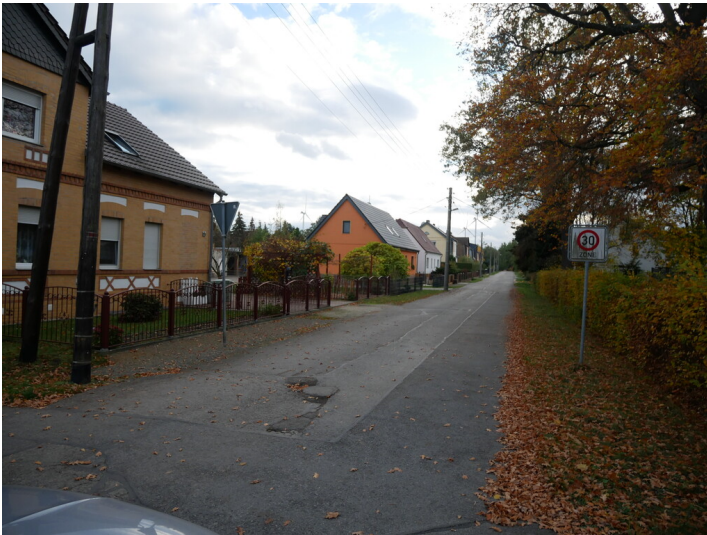
Siedlung Luise