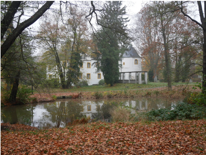
Schloss Sallgast