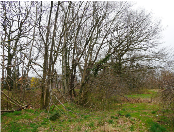
ehem. Wasserzulauf zur Hammermühle