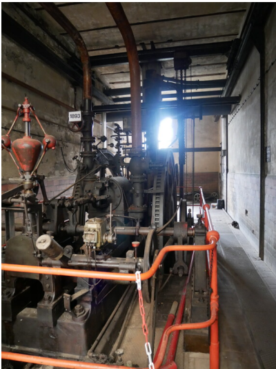
Brikettpresse 6 + 8