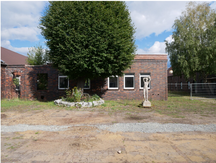
Werkstattgebäude der ehemaligen Brikettfabrik Plessa