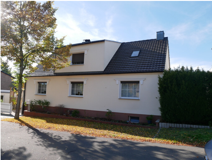
Siedlung Heimat

Schlagwörter: Werkssiedlung Fachsicht(en): Denkmalpflege Gemeinde(n): Plessa Kreis(e): Elbe-Elster Bundesland: Brandenburg