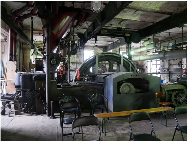
Brikettpresse Nr. 4