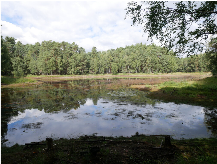
Wassergefüllte Senkung des Tiefbaus der Gruben 'Emilie', 'Louise Anna' bzw. 'Heinrich'