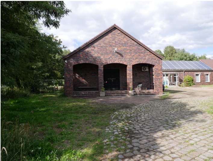
Gefolgschaftshaus der Brikettfabrik Plessa mit Sanitärtrakt

Schlagwörter: Brikettfabrik Fachsicht(en): Denkmalpflege Gemeinde(n): Plessa Kreis(e): Elbe-Elster Bundesland: Brandenburg