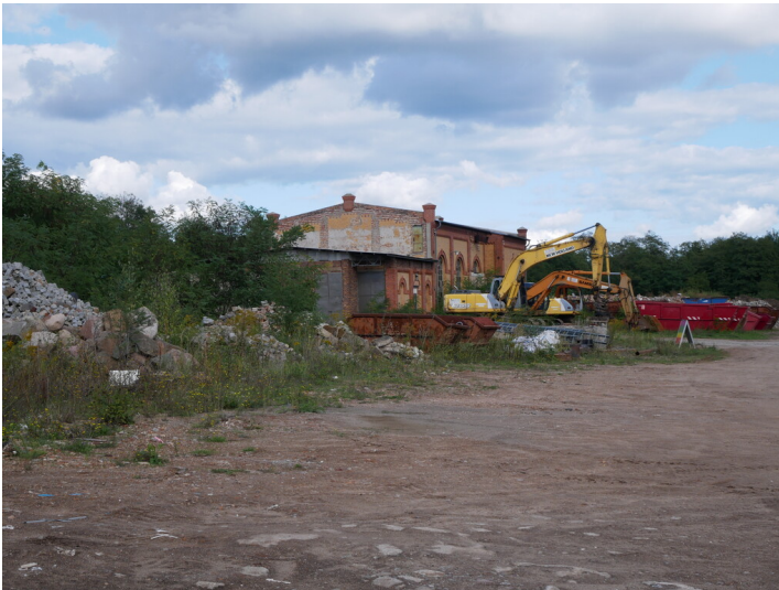
Kraftzentrale Brikettfabrik Plessa