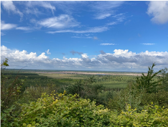
Aussichtspunkt Unser Fritz