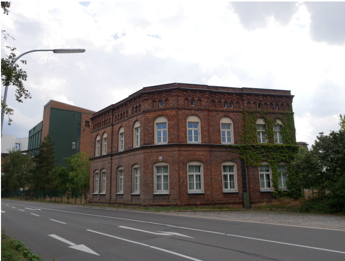
Verwaltungsgebäude Zuckerfabrik