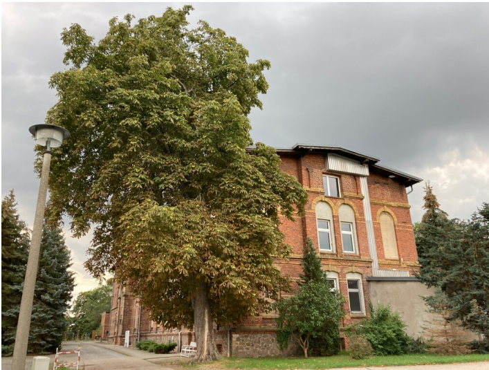
Sozial- und Verwaltungsbau