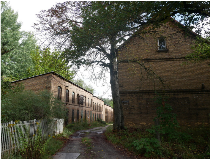
Wohnanlage Unser Fritz