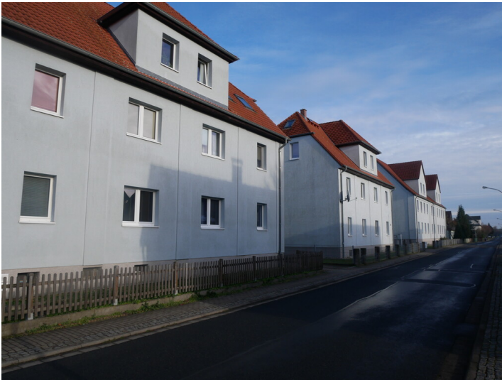
Siedlung Waidmannsheil