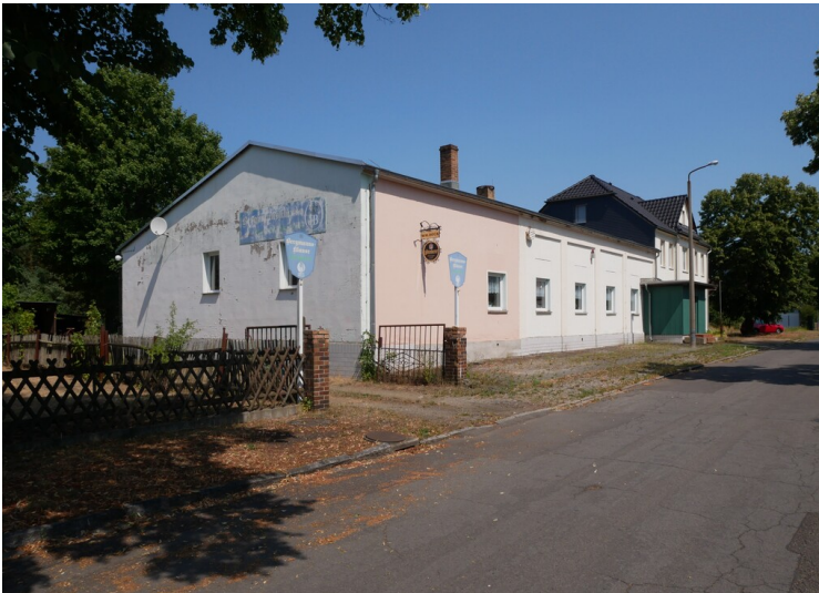
Kulturhaus Schwarzheide-Ost Victoria