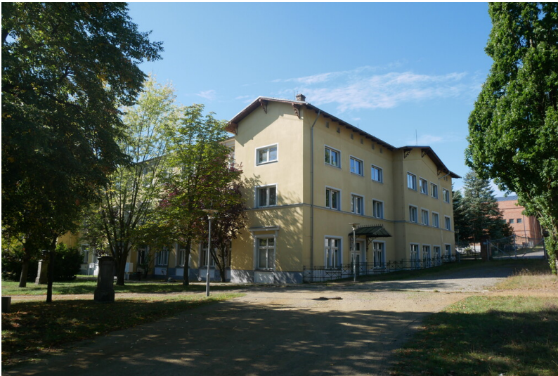
Verwaltungsgebäude I Lauchhammerwerk