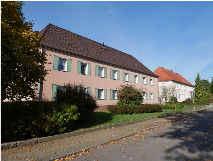
Lehrerdienstwohnungen der Wandelhofschule