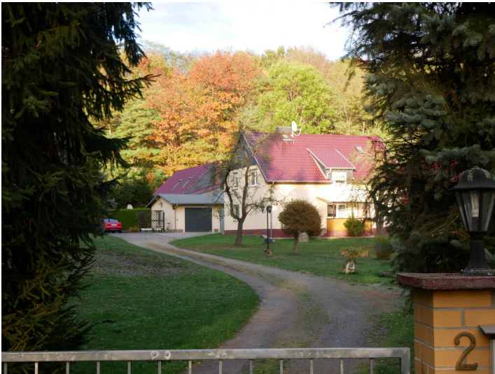
Tagesanlagen Grube Gotthold