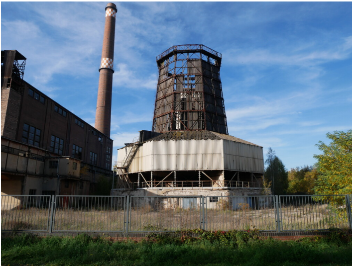
Kühltürme Kraftwerk Plessa