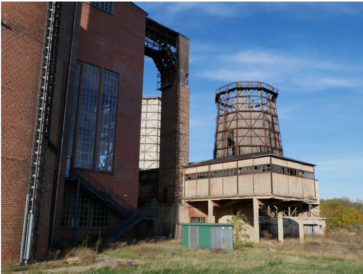
Kohlebunker Kraftwerk Plessa