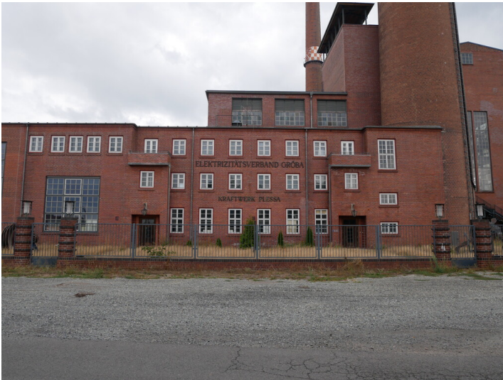
Verwaltungsgebäude Kraftwerk Plessa