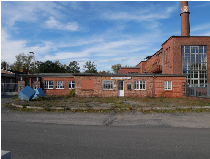
Pförtnerhaus Kraftwerk Plessa