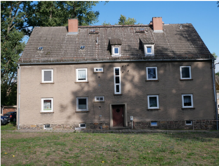
Kraftwerksiedlung Nordstraße