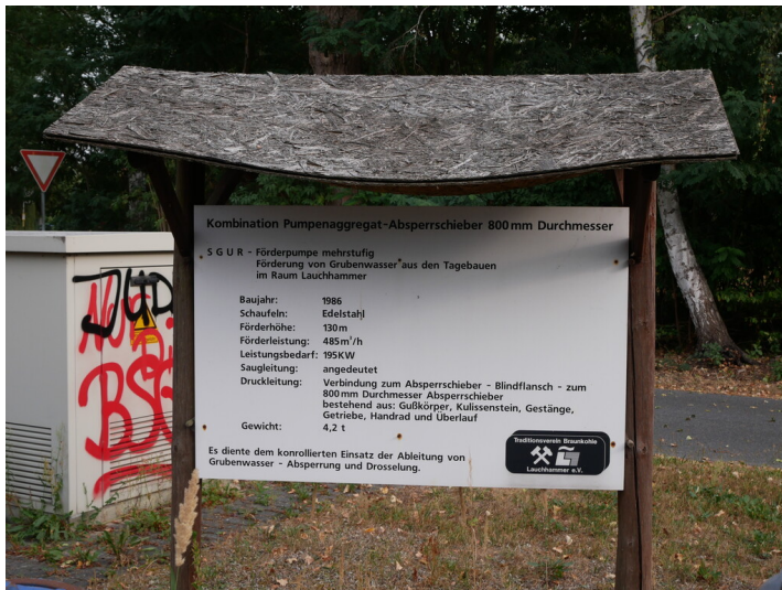
Pumpenaggregat- Absperrschieber